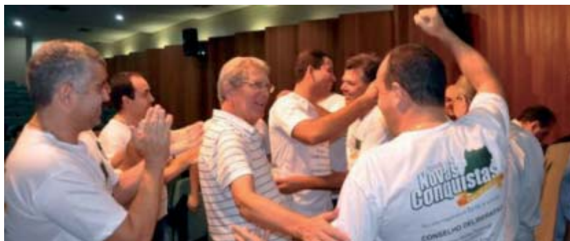
Associados se cumprimentam após anúncio da eleição