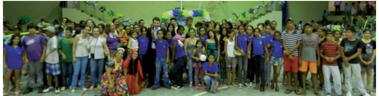
Juiz e alunos da escola Gercina Borges, a grande campeã

Disse que o programa "Justiça vai à Escola" foi maravilhoso. Tanto os alunos, como os professores acharam muito diferente um juiz estar na frente deles dentro da sala de aula.