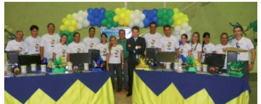
Juiz com os alunos da Universidade de Rio Verde (voluntários)