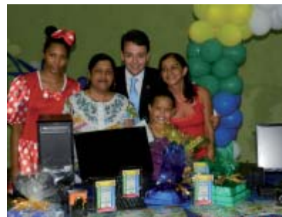
Entrega de computador para a aluna vencedora do concurso de redação da categoria B