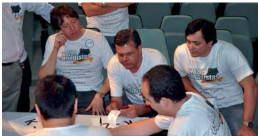
Junta Eleitora apura resultados